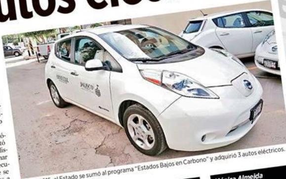
En el 2015, el Estado se sumó al programa “Estados Bajos en Carbono” y adquirió 3 autos eléctricos.

“Y en el caso de que estos vehículos sean utilizados para el servicio público, que todas las concesiones, permisos y autorizaciones se otorguen tam-